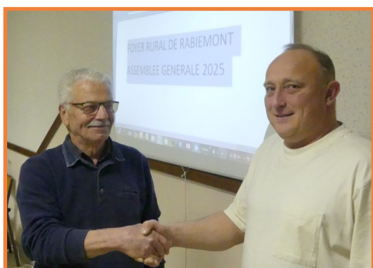
Passage de relais au Foyer Rural de Rabiémont

Souhaitons la bienvenue aux nouveaux et nouvelles élu-e-s Président-e-s des foyers ruraux !